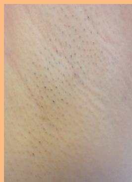
消えない黒ずみ 色素沈着