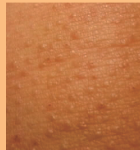
カサカサ、 ぶつぶつ鳥肌