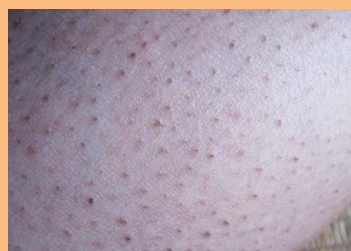
お肌に埋もれる 埋没毛